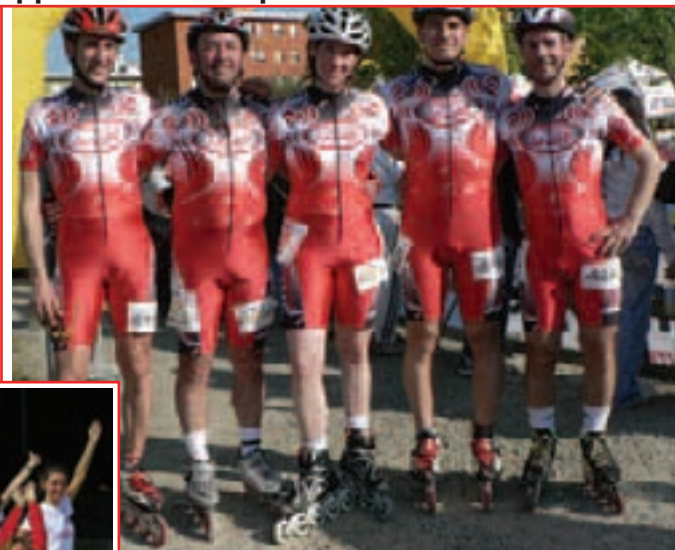
Gruppo Agonistico Corsa Maratona Spilamberto