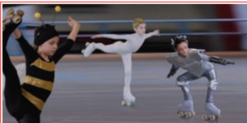
Trofeo Smile. Gli atleti della 3.a categoria