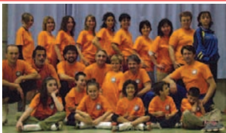
Gruppo Adulti. Bradipi a rotelle!